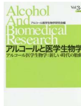
アルコールと医学生物学 Vol.34 2015