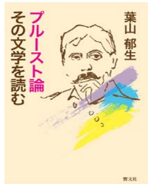
プルースト論 その文学を読む