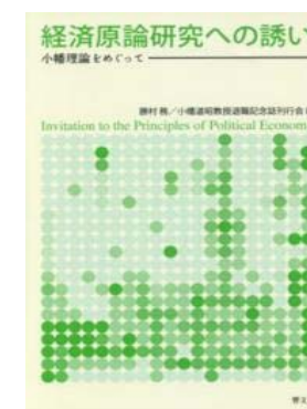
経済原論研究への誘い —小幡理論をめぐって