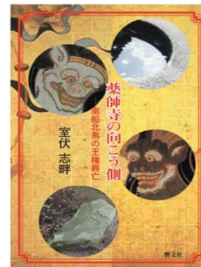
薬師寺の向こう側 —南船北馬の王権興亡—