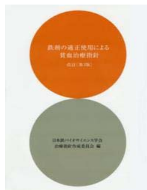
鉄剤の適正使用による貧血治療指針 (改訂第3版)