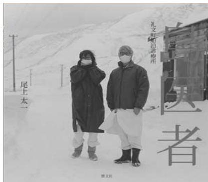
島医者 礼文町船泊診療所